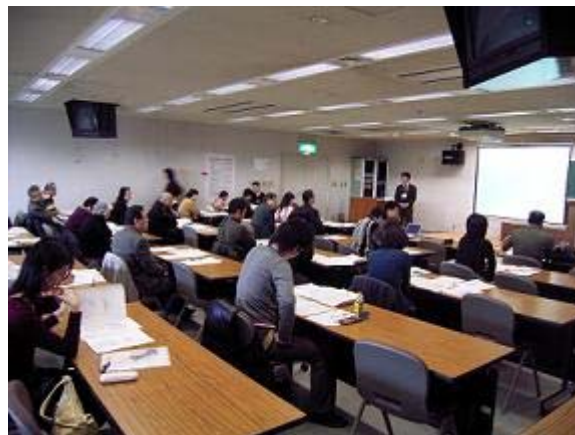
（写真）シナリオの説明風景

最初に、会議の目的と、「15～20 年先の将来社会を見通して、名古屋が目指す将来像と道筋をまとめること」が会議のテーマであることを確認しました（資料 1）。